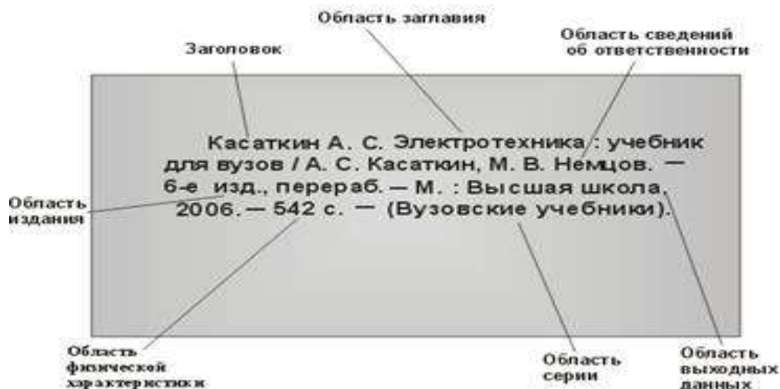
Рисунок 1 – Схема библиографического описания

Источник: Золотарева, В.И. Общие правила оформления библиографического списка и ссылок. Оформление реферата : метод. указания / В. И. Золотарева, И. П. Капочкина, И. П. Евсеева. – М. : МИФИ, 2007. – 25 с.