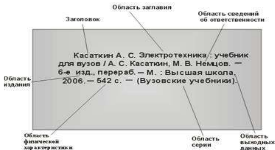
Рисунок 2 – Схема библиографического описания

Более наглядно схема библиографического описания представлена на рисунке 2.